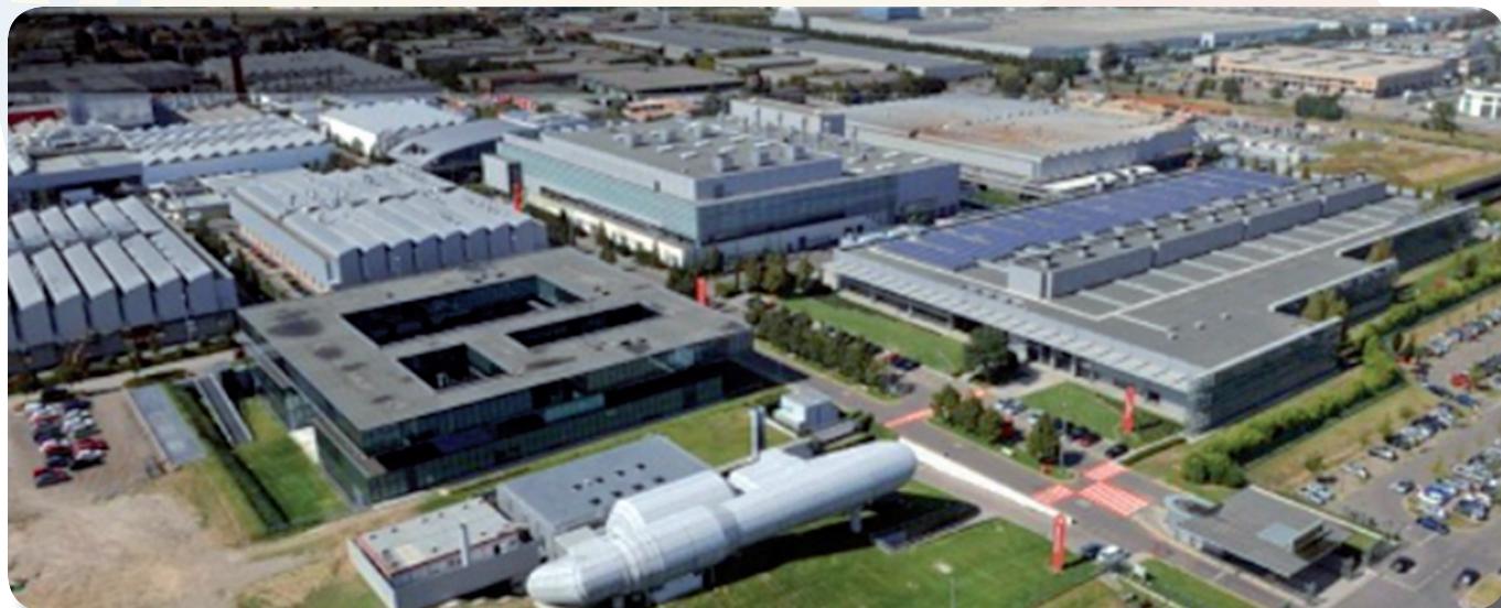
Veduta aerea degli stabilimenti FERRARI

Tutti gli edifici si snodano intorno al Viale Enzo Ferrari, che percorre l'intera cittadella e su cui convergono le varie vie intitolate ai grandi Piloti Ferrari. Luminosità, climatizzazione, basso impatto ambientale, sicurezza, controllo della rumorosità, aree di ristoro e veri e propri giardini anche all'interno degli edifici