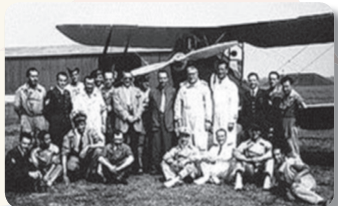
Padre Agostino GEMELLI tra amici aviatori

La statua di Padre GEMELLI , con il saio francescano e il caschetto da Pilota, posta nel 1964 nell'atrio del Centro Sperimentale Volo dell'Aeronautica Militare di Pratica di Mare è rappresentativa dell'enorme contributo apportato e lo ricorda a quanti oggi in Italia compiono gli studi più avanzati di Medicina Aeronautica.