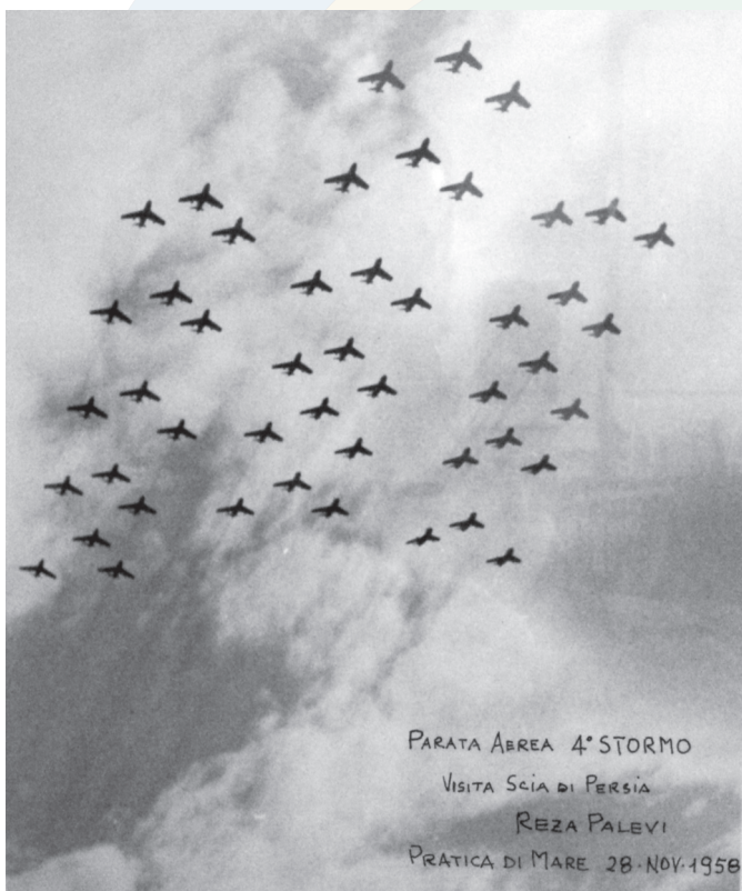
PARATA AEREA 4° STORMO VISITA SCIA DI PERSIA REZA PALEVI PRATICA DI MARE 28 NOV 1958

Grande manifestazione: decollo del IX°, X° e XII° Gruppo per un totale di 48 F 86 E.