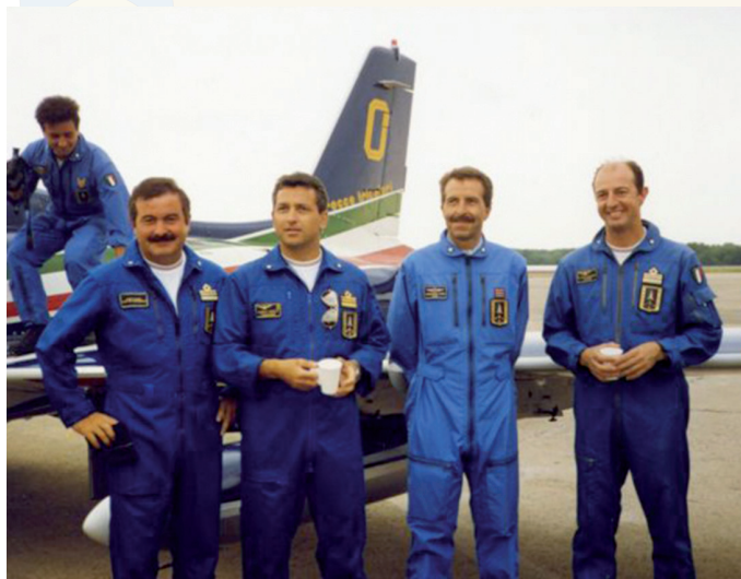
..all'ultima trasferta prima del congedo..