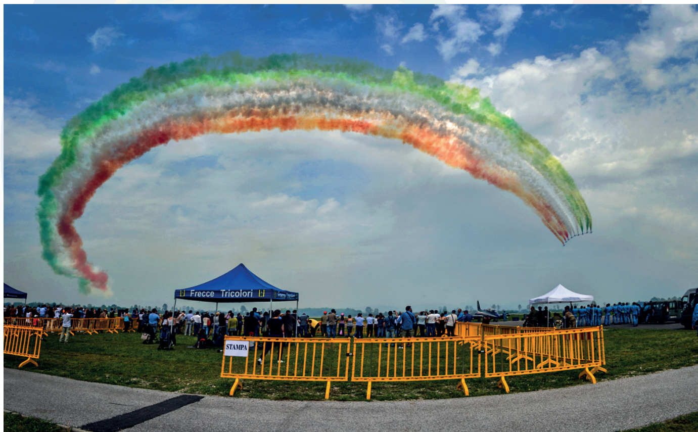
Saluto delle "Frecce Tricolori"

Successivamente, con il trasferimento in area centrale, si é assistito al volo acrobatico inaugurale della stagione 2014 delle "Frecce Tricolori" .