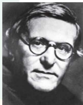
Padre Agostino GEMELLI fondatore della Medicina Aeronautica

Durante il secondo conflitto mondiale, un Pilota che aveva conoscenza della "Psicologia" ha aperto un dialogo tra questi due mondi, dimostrando che i Piloti e la "Psicologia" possono comunicare.