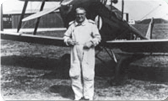
Padre Agostino GEMELLI in "versione aeronautica"

L'idea di partenza di Padre Agostino GEMELLI fu che l'idoneità al volo non poteva basarsi solo su requisiti psicofisici, ma doveva anche valutare la presenza di altre qualità positive e una di queste fu individuata nell'area dell'emotività.