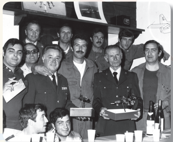
.. con i colleghi alla cena di saluto .. Rivolto 1978

Tutto era pronto per il rientro, solo che all'accensione del motore del primo velivolo, i tedeschi illuminarono a giorno tutto l'idroscalo. Il nostro piano di fuga/rientro era fallito ed il giorno seguente partimmo tutti in treno per due anni di “Erasmus” in Germania. Rientrato dalla Germania continuai quindi la mia carriera militare nuovamente a Taranto, poi a Brindisi, Lecce, Istrana e quindi a Rivolto.»